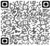
Calonectris edwardsii - Pardela de Cabo Verde