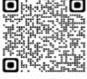
Procellaria cinerea - Petrel ceniciento