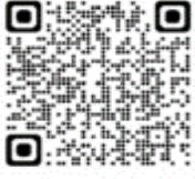
Pterodroma mollis - Petrel collar gris