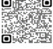
Pterodroma incerta - Petrel cabeza parda