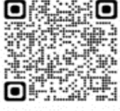
Puffinus griseus - Pardela oscura