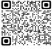
Procellaria aequinoctialis - Petrel de barba blanca