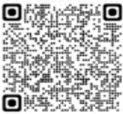
Pterodroma arminjoniana - Petrel de Trindade