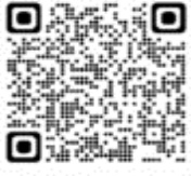
Macronectes halli - Petrel gigante oscuro