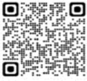
Macronectes giganteus - Petrel gigante común