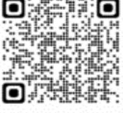
Fulmarus glacialis - Petrel plateado