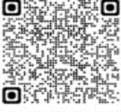
Procellaria conspicillata - Petrel de anteojos