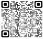
Puffinus gravis (Ardenna gravis) - Pardela Cabeza negra