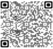
Diomedea dabbenena - Albatros de Tristán