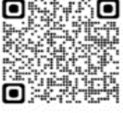
Pterodroma (Lugensa) (Aphrodroma) brevirostris - Petrel plomizo